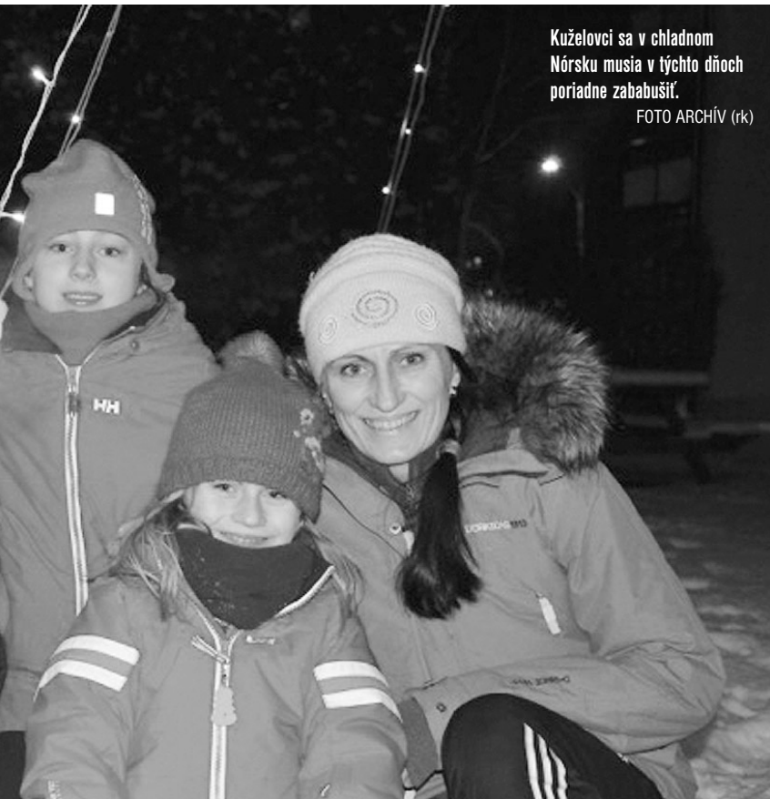
Kuželovci sa v chladnom Nórsku musia v týchto dňoch poriadne zababušiť.